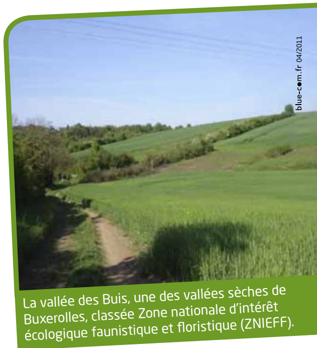
La vallée des Buis, une des vallées sèches de Buxerolles, classée Zone nationale d'intérêt écologique faunistique et floristique (ZNIEFF).

La biodiversité nous concerne tous : en respectant ces lieux, vous protégez la biodiversité locale.